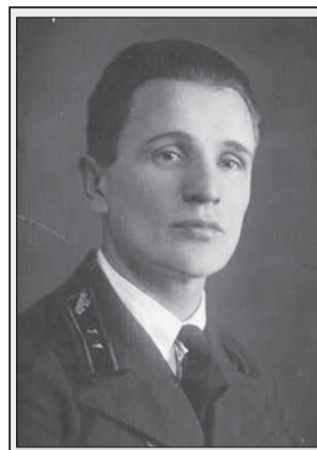
Зиновий Григорьевич Колобанов.

танк в мире на тот период. Немцы были от него в панике, его не брал ни один снаряд. Когда восстановим, он будет на ходу, то есть будет исторический памятник технического устройства. А на постаменте – дождь, мороз, проявления вандализма могут быть. Думаю, подвергать этому такую машину будет неправильно».