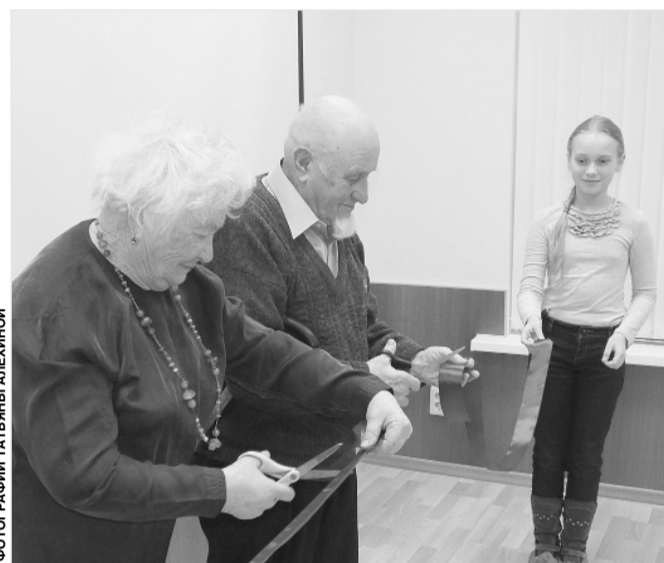
ФОТОГРАФИИ ТАТЬЯНЫ АЛЕХИНОЙ